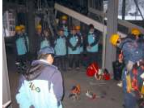
① ロープウェイ山麓線