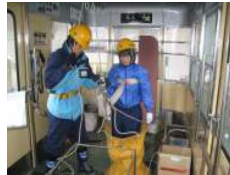
② ロープウェイ山頂線